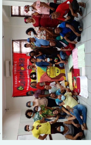
Figura 6. Encontro Defensores Quilombolas em Brasília