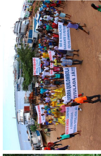
Figura 8. Manifestação exigindo a publicação pelo Incri do relatório de identificação da terra no Alto Trombetas — Quilombolas de Oriximiná — PA, 2016.

Vivemos os tempos mais difíceis que a história já pôde contar. Todavia, buscamos no conceito epistemológico de kilombo uma união de forças capazes de nos manter vivos e vivas, tal como nossos(as) ancestrais fizeram ao recriar nos quilombos, nos terreiros de religiões de matrizes africanas e nas diversas etnias indígenas, espalhados por todo o território brasileiro, a compreensão de coletividade como estratégia de luta e reexistência para que hoje pudéssemos ter acesso à herança cultural, política, filosófica, religiosa e pedagógica deixada por nossos(as) antepassados(as). As Trilhas afro-indígenas brasileiras são uma revisão histórica da ancestralidade indígena e negra do Brasil. Visto que nosso país possui a maior diáspora africana e que há 305 etnias indígenas no Brasil e 22 na Bahia, precisamos revisar a nossa história de vida, a nossa ancestralidade pelas vias da diversidade, pela quebra dos referenciais brancos de uma história única, pela necessidade de fazermos