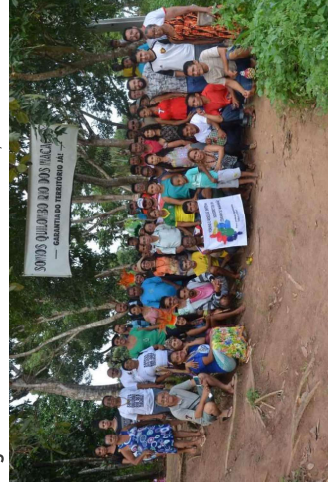
Figura 7. Quilombo Rio dos Macacos, 2019