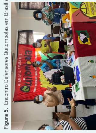
Figura 5. Encontro Defensores Quilombolas em Brasília