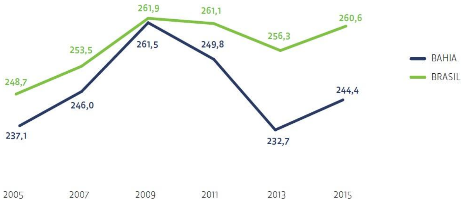
GRÁFICO 3 | SAEB Língua Portuguesa Bahia x Brasil